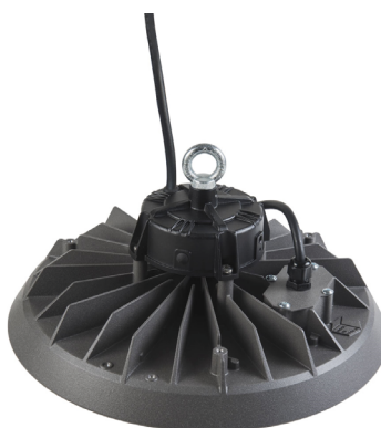
88W, 136W, 177W