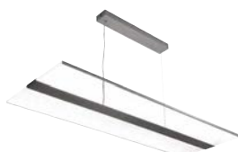
SAIL - P 88